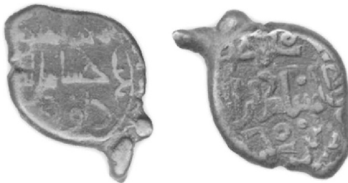
სურ. 1 სიმონ ჯანაშიას სახელობის საქართველოს მუზეუმის ცალი