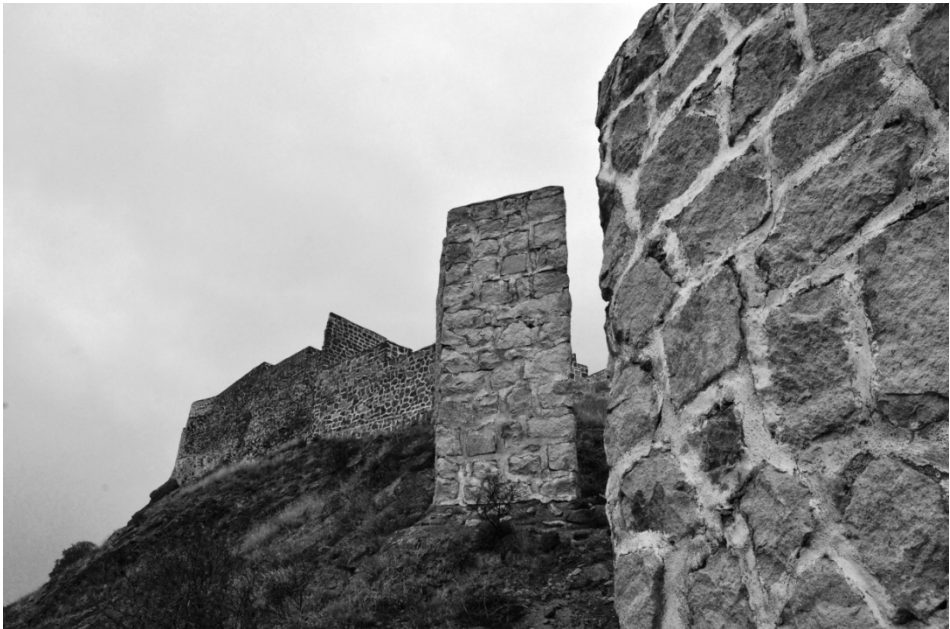
2. სამკარის ციხის შესასვლელი ხედი ციხის ჩრდილო-დასავლეთის კედელზე