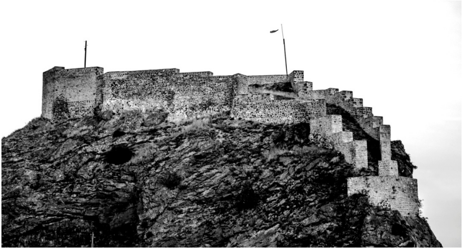
1. სამკარის ციხე (გიორგი ბაგრატიონის ფოტო)