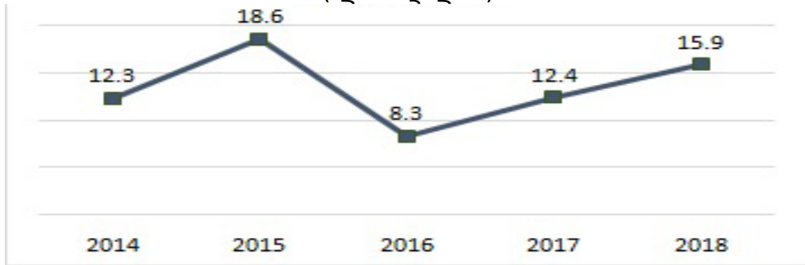
პირდაპირი უცხოური ინვესტიციები(პუი) სოფლის მეურნეობასა და მეთევზეობაში (მლნ აშშ დოლარი)